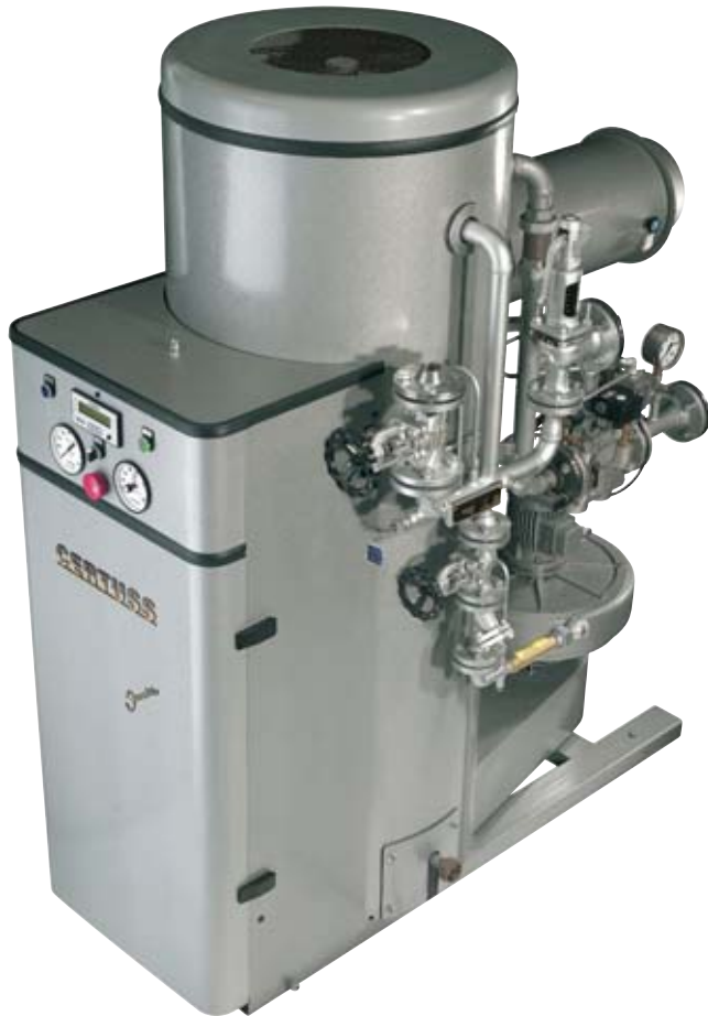
Junior SC Kapacitet 80 - 600 kg/h