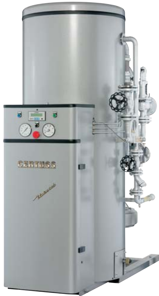
Universal SC Kapacitet 700 - 1800 kg/h